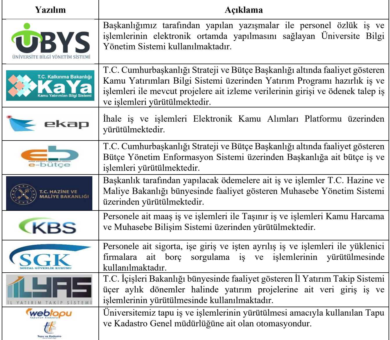
Tablo:3 Birim Yazılım Kaynak Sayıları