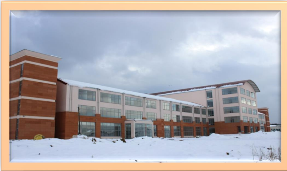
Resim:4 Sivil Havacılık Yüksekokulu Dıştan Görünüş