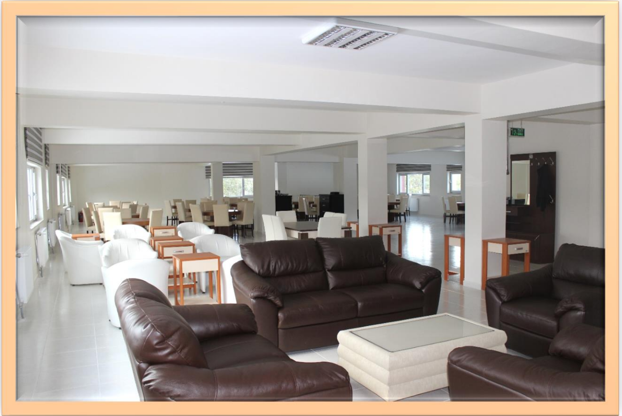
Resim:3 Kastamonu Meslek Yüksekokulu Sosyal Tesis İçten Görünüş