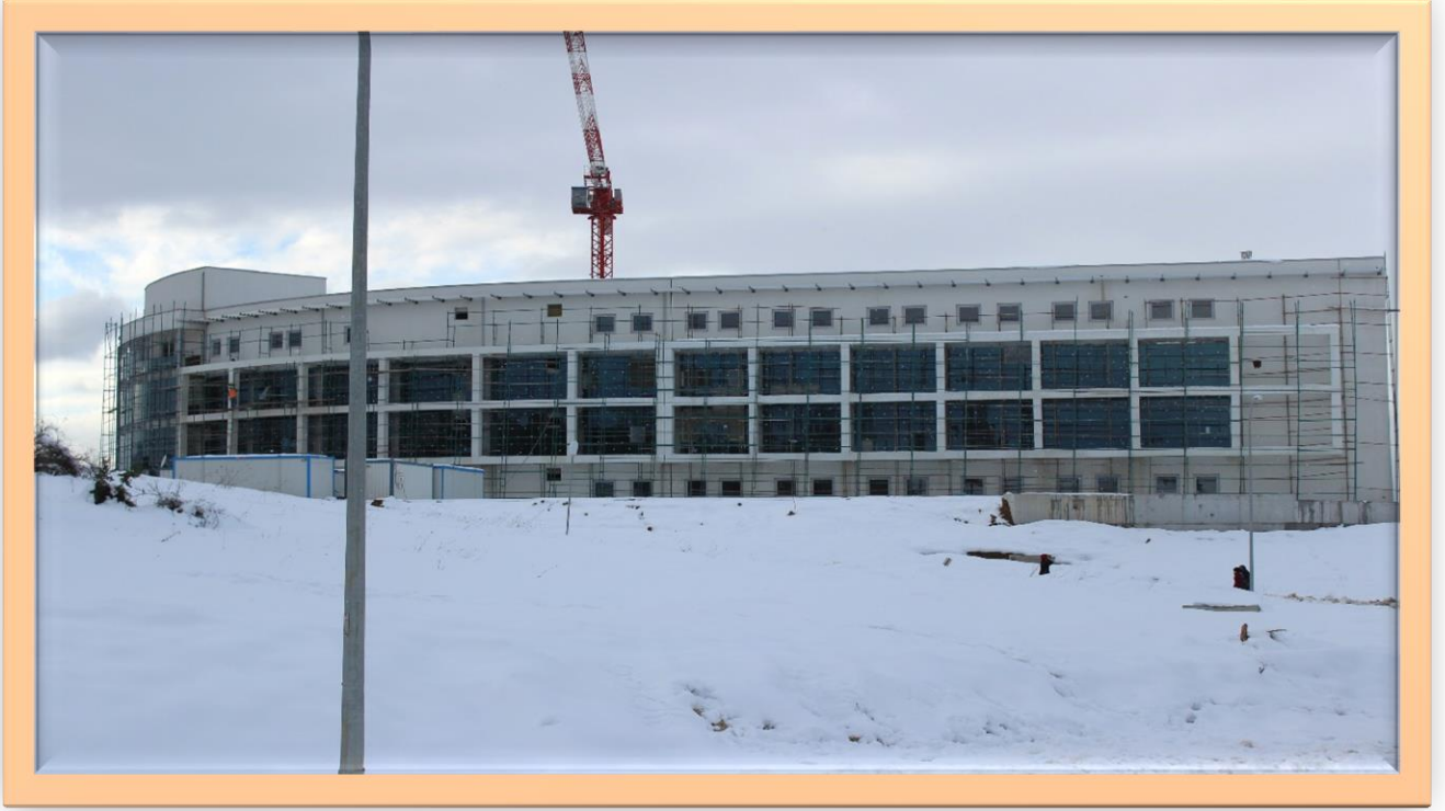
Resim:10 Rektörlük Binası Genel Görünüş