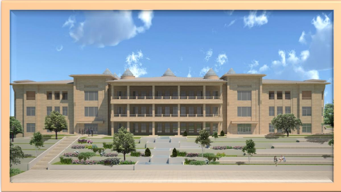
Resim:1 Merkezi Yemekhane Binası ve Sosyal Tesis Render Görüntüsü