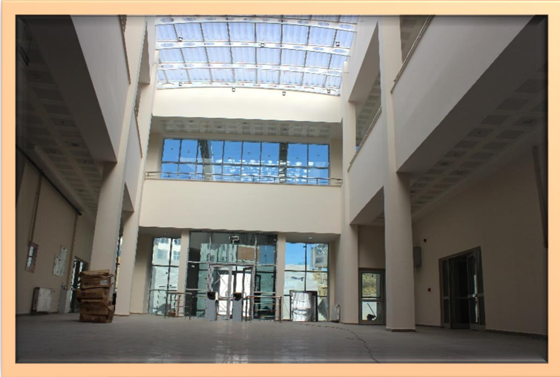
Resim:9 Merkezi Araştırma Laboratuvarı İçten Görünüş