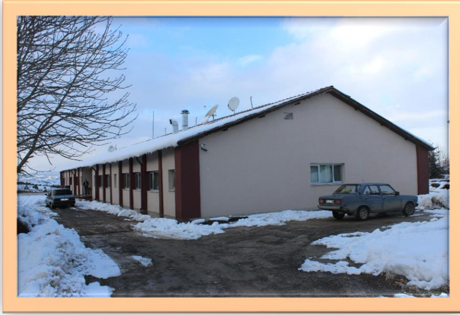
Resim:2 Kastamonu Meslek Yüksekokulu Sosyal Tesis Dıştan Görünüş