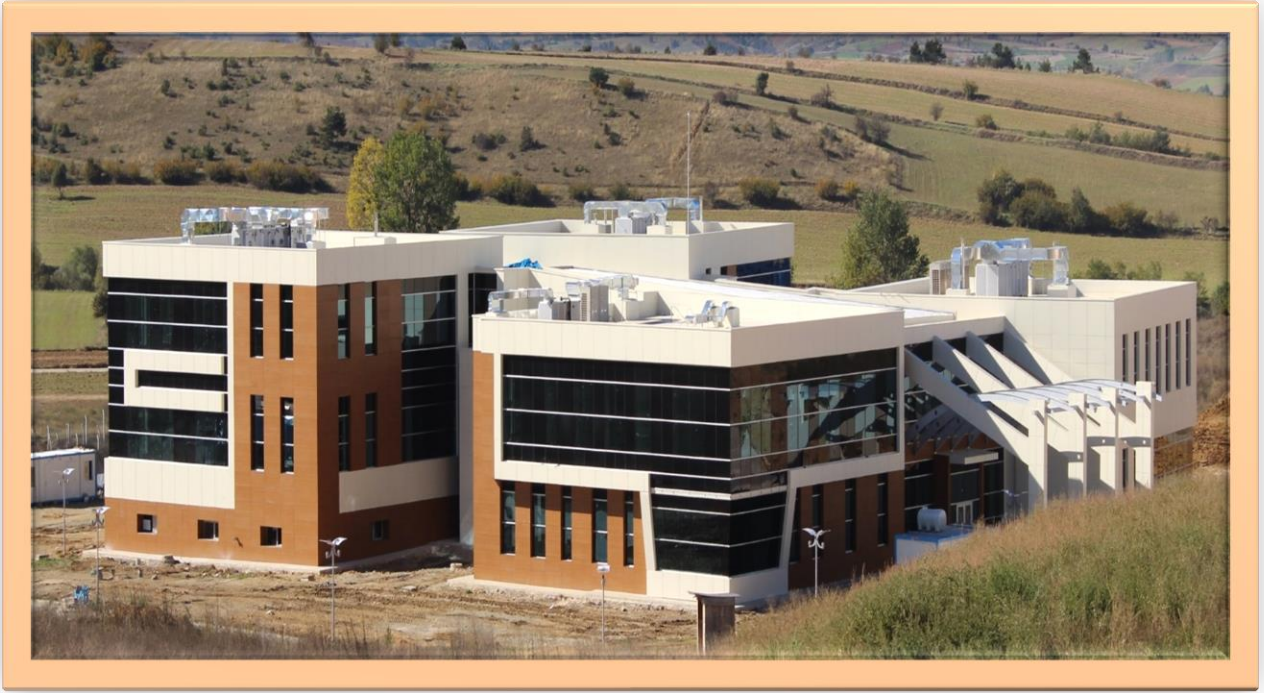
Resim:8 Merkezi Araştırma Laboratuvarı Genel Görünüş