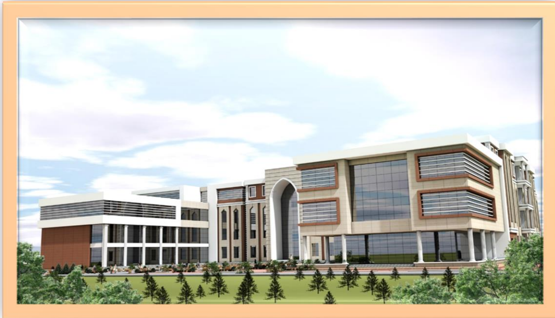
Resim:5 İletişim Fakültesi Render Görüntüsü