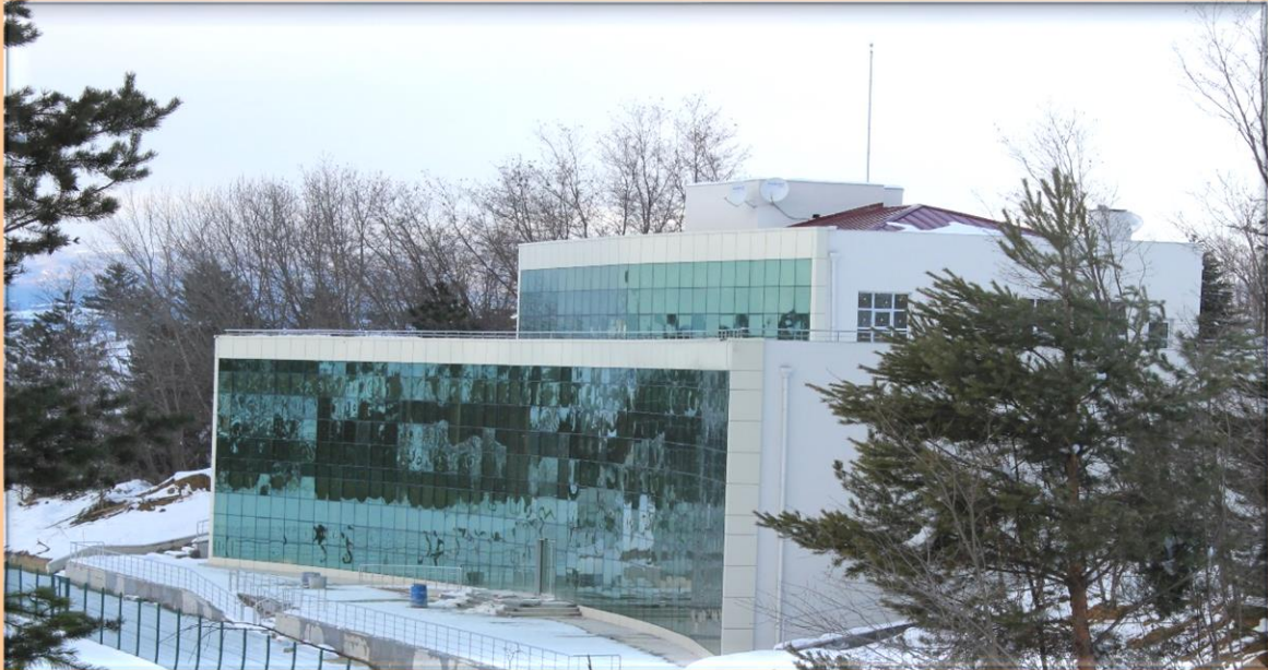
Resim:7 Spor Tesisi İdari Hizmet Binası Önden Görünüş