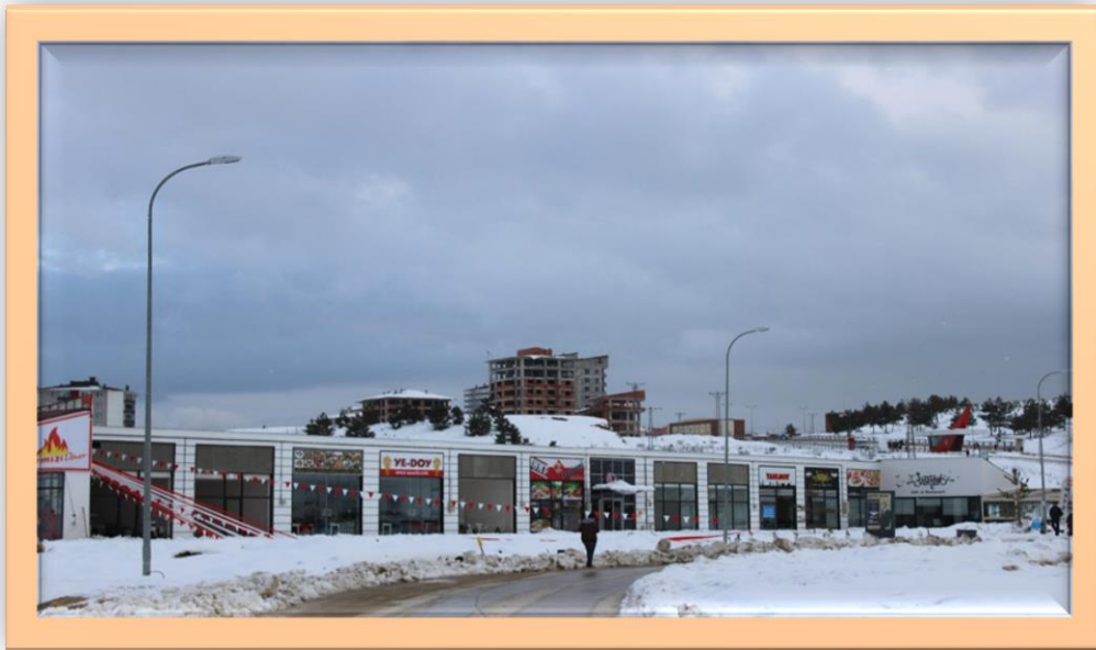
Resim:13 Kampüs Alanı Çarşı Genel Görünüş