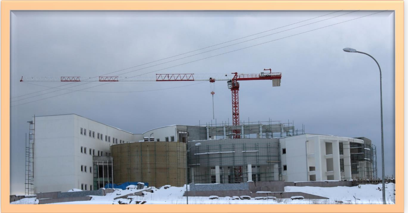
Resim:11 Rektörlük Binası Genel Görünüş