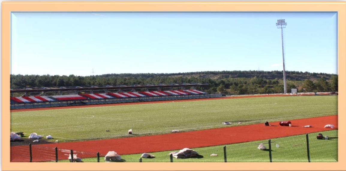
Resim:6 Futbol Sahası ve Atletizm Pisti Genel Görünüş