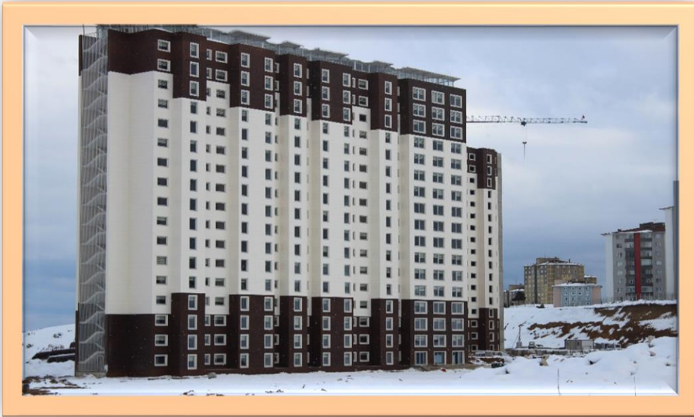
Resim:14 Kampüs Alanı Yurt Genel Görünüş