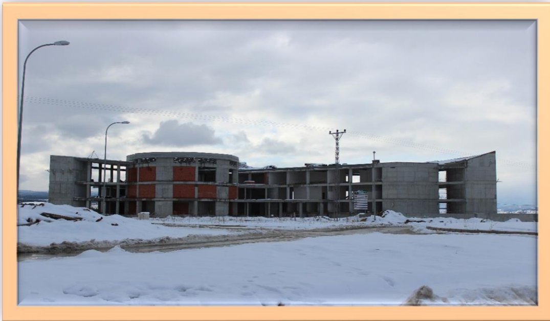
Resim:12 Merkezi Kütüphane Binası Genel Görünüş